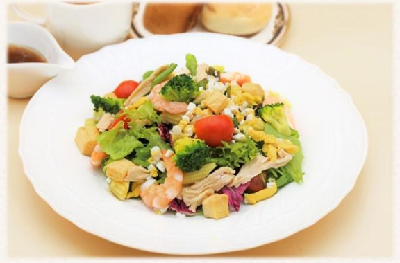
サラダランチ (シーザー又は和風ノンオイル) ¥1,540 (税抜価格¥1,400)