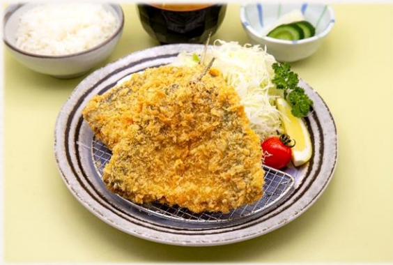
アジフライ定食 ¥1,760 (税抜価格¥1,600)