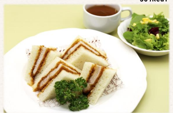
カツサンド(八幡平ポーク) ¥1,540 (税抜価格¥1,400)