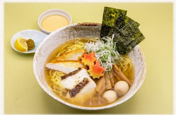
鯛ラーメン ¥1,760 (税抜価格¥1,600)