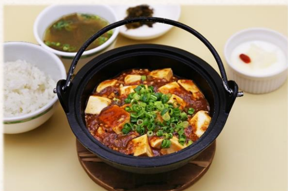
四川風 麻婆豆腐定食 🌶️