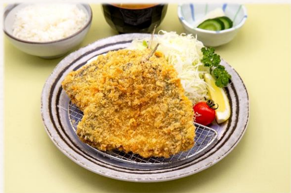
アジフライ定食 ¥1,760 (税抜価格¥1,600)