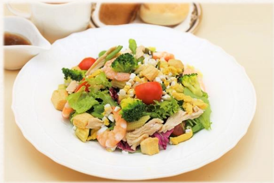
サラダランチ (シーザー又は和風ノンオイル) ¥1,540 (税抜価格¥1,400)