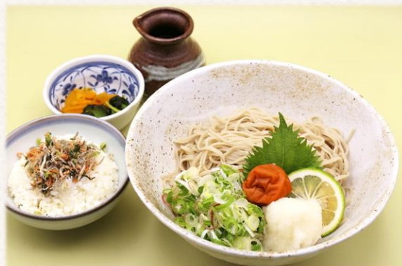
薬味梅おろしそば・うどん (ちりめん彩りご飯付き)