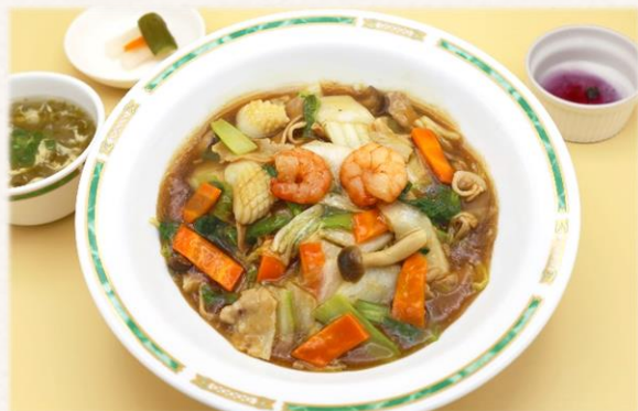
五目あんかけ焼きそば ¥1,760 (税抜価格¥1,600)