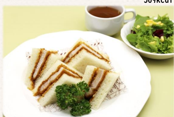
カツサンド(八幡平ポーク) ¥1,540 (税抜価格¥1,400)