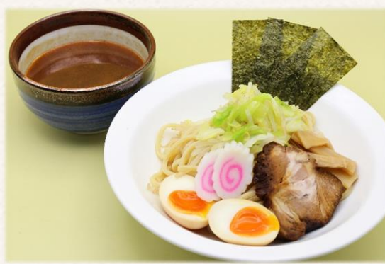
つけ麺(全粒粉入り) ¥1,760 (税抜価格¥1,600)